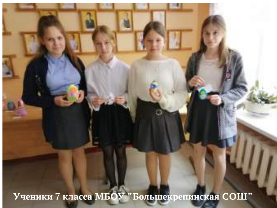
Ученики 7 класса МБОУ "Большекрепинская СОШ"

В заключении хочу подчеркнуть, что проведённая предметная декада как нельзя лучше раскрывает творческий потенциал педагогов иностранных языков. Это не только новый этап в профессиональной деятельности учителей, но и замечательная возможность выйти на новый уровень отношений с коллегами и учениками.