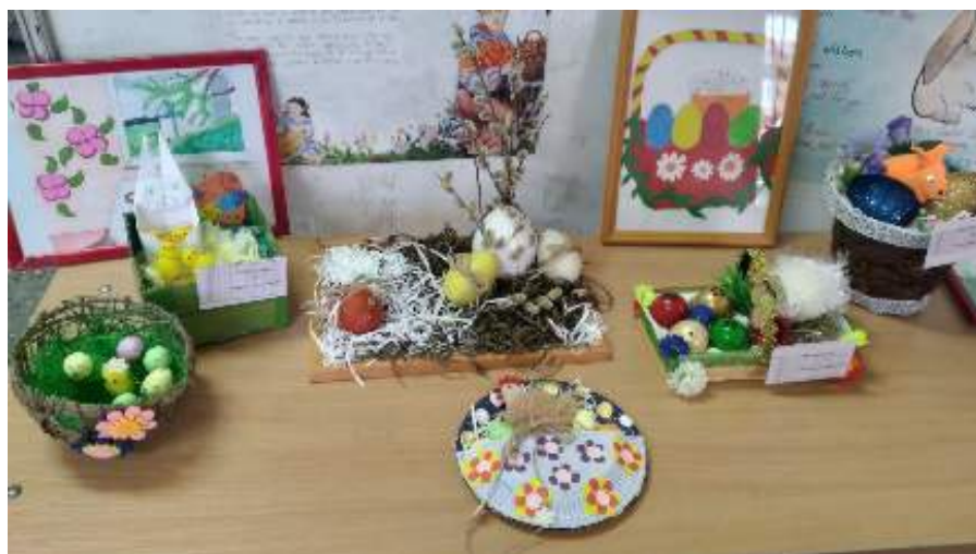
«Родионово-Несветайская СОШ №7»