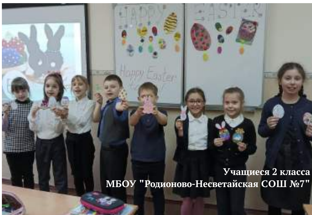
Учащиеся 2 класса МБОУ "Родионово-Несветайская СОШ №7"

Значение внеклассной деятельности по иностранным языкам сложно переоценить. Внеклассная работа не только улучшает навыки владения иностранными языками, но и способствует повышению уровня лингвострановедческого кругозора учащихся, развитию их творческой стороны и увеличивает уровень мотивации к изучению языка и культуры другой страны.