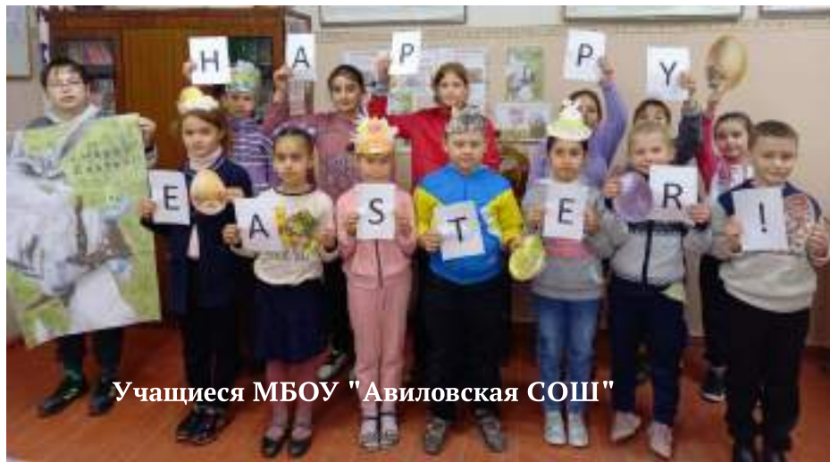
Учащиеся МБОУ "Авилловская СОШ"

палитета, изучающему иностранный язык, была дана возможность применить свои знания на практике. Для учеников это был и праздник знаний, и стимул для дальнейшего изучения предмета.