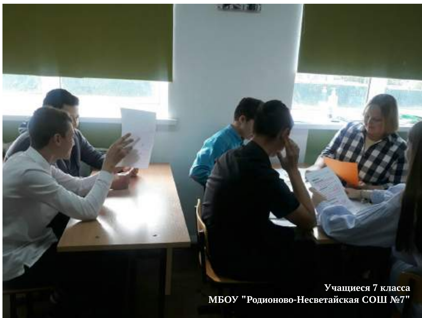
Учащиеся 7 класса МБОУ "Родионово-Несветайская СОШ №7"

В заключении нужно отметить, что во время проведения декады учащиеся показывают высокие результаты, что впоследствии положительно влияет на их мотивацию к изучению иностранного языка. Как показывает практика, внеклассная деятельность способствует раскрытию индивидуальных способностей школьников, которые не всегда проявляются на уроке. А многообразие форм и приемов делают изучение иностранного языка более увлекательным и интересным.